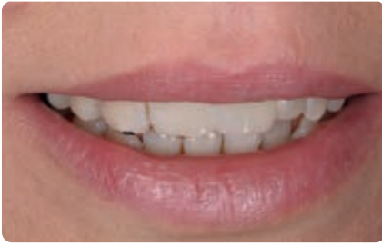
Abb. 8 Die Kompositfarben A3,5B, A2B und A1E (Filtek Supreme XTE, 3M Espe) werden mittels Heidemannspatel auf die Zähne aufgetragen und freihändig modelliert. Die Oberflächentextur wird mithilfe eines Komposit-Modellierpinsels verfeinert und anschließend lichtgehärtet