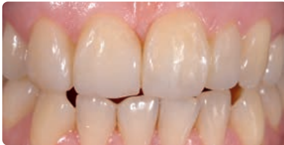
Abb. 19 bis 21 Das Ergebnis in der intraoralen Ansicht und als Portrait: Im Rahmen der praktisch non-invasiven Frontzahnästhetik-Behandlung wurden der front-offene Biss geschlossen, der Zahn 13 zum seitlichen Schneidezahn umgeformt, der Zahn 22 optisch gedreht sowie der Verlauf der gesamten Lachlinie harmonisiert