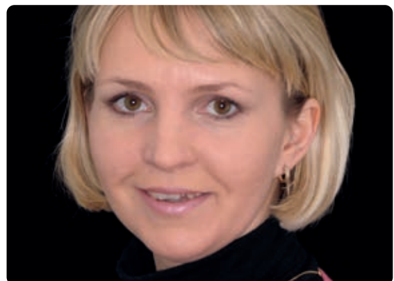
Abb. 1 Die 33-jährigen Patientin war unzufrieden mit ihrem Lächeln, wollte jedoch keinesfalls, dass die Zähne beschliffen werden

Damit hat der Patient die Möglichkeit, die neue Optik der Zähne im Zusammenspiel mit den Lippen und dem