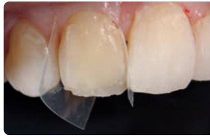
Abb. 12 Zahn 11: Die Gestaltung eines palatinalen Shells erfolgt mit der Schmelzmasse (A1E) und mittels Silikonsschlüssel (nicht abgebildet). Anschließend werden die Klarsichtmatrizen positioniert sowie die Randleisten und Labialflächen gestaltet