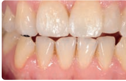
Abb.9 Auf eine Politur nach der Lichthärtung wird beim Mock-up gänzlich verzichtet