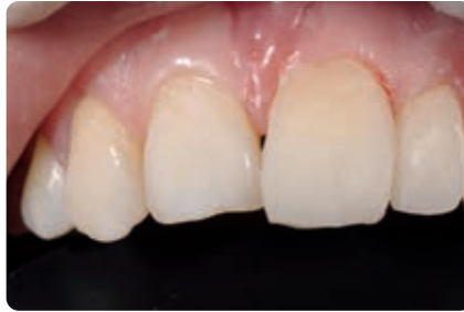
Abb. 15a Jeder Zahn (hier 21) wird nach der definitiven Lichthärtung einzeln konturiert und vor allem im Übergangsbereich approximal, labial und im interdentalen Dreieck vollständig ausgearbeitet