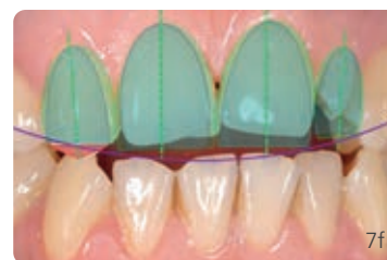
Abb. 7a bis f Schematische Darstellung der ästhetischen Planung: a) bei virtueller Verbindung der Inzisalkanten: negative Lachkurve b) Planung neuer Zahnurisse bei frontaler Ansicht c) Positionierung der neuen Zahnleisten mit einprogrammierter optischer Täuschung d) Shaping der Eckzahnspitze 13 und dessen Umformung zum seitlichen Schneidezahn e) Schaffung neuer Ausrichtung der Zahnachsen f) schematische Gesamtplanung der optischen Neupositionierung der Zähne und Erzeugung einer positiven Lachlinie