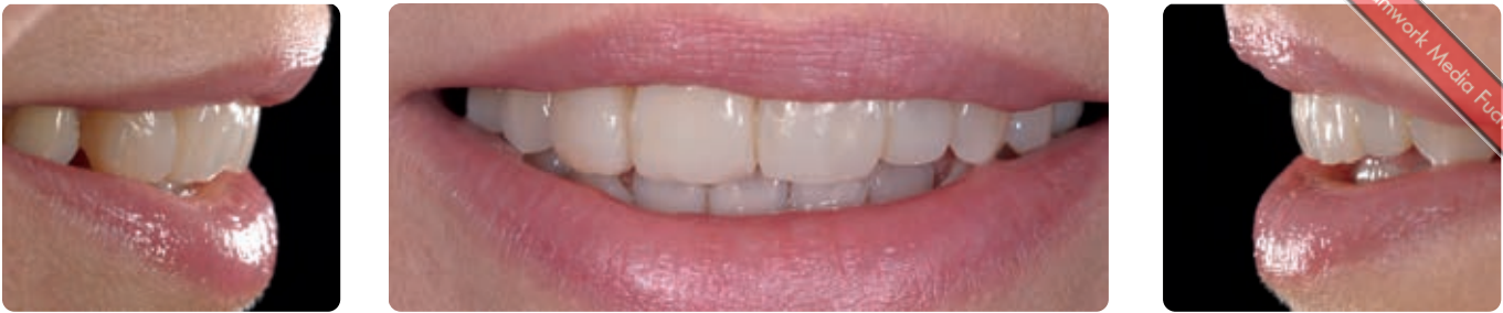
Abb. 16 bis 18 Nach dem Komposit-Veneering im direkten Verfahren zeigt sich ein harmonisches Lippenbild beim Lächeln sowie in der Seitenansicht

Abb. 19 bis 21 Das Ergebnis in der intraoralen Ansicht und als Portrait: Im Rahmen der praktisch non-invasiven Frontzahnästhetik-Behandlung wurden der front-offene Biss geschlossen, der Zahn 13 zum seitlichen Schneidezahn umgeformt, der Zahn 22 optisch gedreht sowie der Verlauf der gesamten Lachlinie harmonisiert