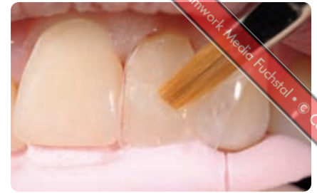
Abb. 13 Die Textur- und Oberflächengestaltung geschieht mithilfe eines Modellierpinsels: Von der Schneidekante nach zervikal nimmt die Schichtstärke der verwendeten Schmelzschicht (A1E) zu Gunsten der Bodymasse (A2B, A3,5B) deutlich ab. Die angestrebte Korrektur der Zahnlänge und -achse von Zahn 21 ist hier in der Negativform des Silikonsschlüssels gut sichtbar

und entspannter Lippenposition sichtbar ist. Gleichzeitig soll der Zahn trotz des vorliegenden Engstandes deutlich breiter erscheinen. Wie wir jedoch aus der Ästhetiklehre wissen, sorgt die Verlängerung eines Objekts dafür, dass es für das menschliche Auge schmaler erscheint. Im Folgenden soll darauf eingegangen werden, wie und mit welcher Technik dies ästhetisch trotzdem lösbar ist.