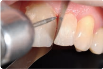
Abb. 14 Ist die Randleiste am Nachbarzahn (hier Zahn 11) noch nicht modelliert, ist ein besserer Zugang sowie die Führung der rotierenden Instrumente am labio-approximalen Übergang möglich. Auf der anderen Seite (zum Zahn 22 hin) wird die bereits aufgebaute Komposit-Randleiste beim Finieren durch ein Metall-Matrizenband geschützt