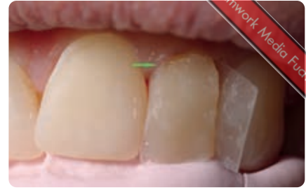
Abb. 10 Modellation Zahn 22. Subgingivale Lage der Matrice; palatinale Adaptation sowie Kontrolle der Längengestaltung mittels Silikon-schlüssel. Die Randleisten werden sehr weit nach mesial beziehungsweise distal verlegt, dadurch wirkt der Zahn optisch breiter. Außerdem wird der Approximalbereich in Form einer breiten Approximalfläche anstelle eines -kontaktes gestaltet, dies „streckt“ den Zahn zusätzlich