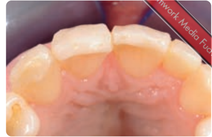
Abb. 15b Die Zähne werden je nach Bedarf unterschiedlich dick aufgebaut (zum Beispiel Zahn 11 deutlich stärker als 21). Auch innerhalb eines Zahns können die Schichtstärken variieren (Zahn 13 ist im mesio-labialen Bereich stärker mit Komposit aufgebaut, nach distal hin nimmt die Stärke des Kompositveneers tangential ab)

Nach Abschluss der Modellation und Lichthärtung erfolgte die Ausarbeitung mit rotierenden Instrumenten (Abb. 14). Es hat sich bewährt, jeden Zahn einzeln nahezu vollständig fertigzustellen, bevor man mit der nächsten Modellation beginnt (Abb. 15). So ist eine bessere Zugänglichkeit gewährleistet und eine definitiv fertiggestellte Form gibt eine verlässliche Orientierung für die Gestaltung des nächsten Zahns. Lediglich die subgingivale Politur des zerviko-labialen Bereichs wird zuletzt durchgeführt, da diese natürlich eine Blutung provoziert. Dieser Bereich ist jedoch auch nach Abschluss der Modellation sehr gut erreichbar. Mit der gleichen Technik werden nach und nach die Zähne 21, 11 und 13 modelliert. Bei der Umgestaltung des rechten oberen Eckzahns kommt erschwerend hinzu, dass dieser nicht nur per se breiter ist als ein seitlicher Schneidezahn, sondern durch dessen labiale Lage an Position 12, diese Breite auch vollständig sichtbar ist. Um diesen Zahn mit additiven Maßnahmen schmaler erscheinen zu lassen, spielt wieder die Neupositionierung der Randleiste eine entscheidende Rolle. Dazu wird die mesiale Randleiste deutlich zur Zahnmitte hin verschoben und die Labialfläche nach distal auslaufend gestaltet. Im distalen Bereich wird die eigene Zahnleiste lediglich nach zervikal verlängert, um den Zahn schlanker erscheinen zu lassen. Abschließend wird die Eckzahnschmelzspitze um zirka 1 mm gekürzt.